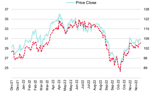
Minor International (MINT TB)