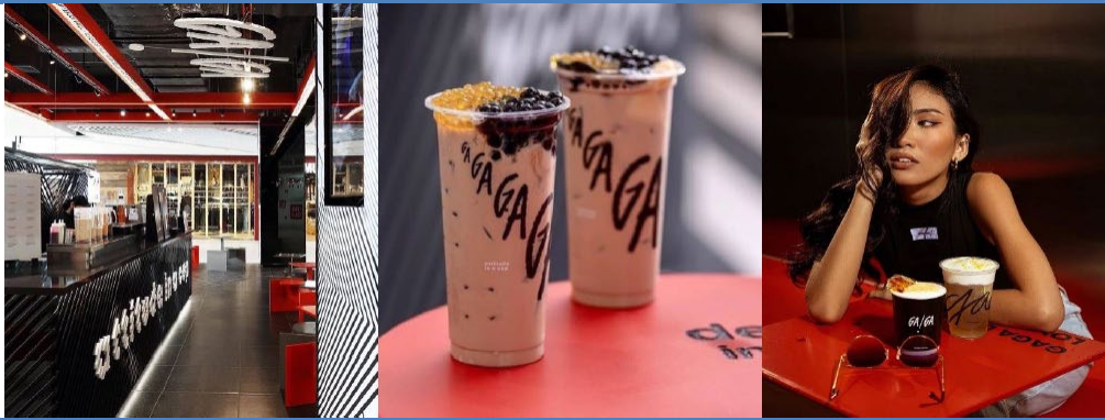
Figure 1: GAGA Attitude-in-a-Cup; beverage café outlets are Minor Food's latest JV